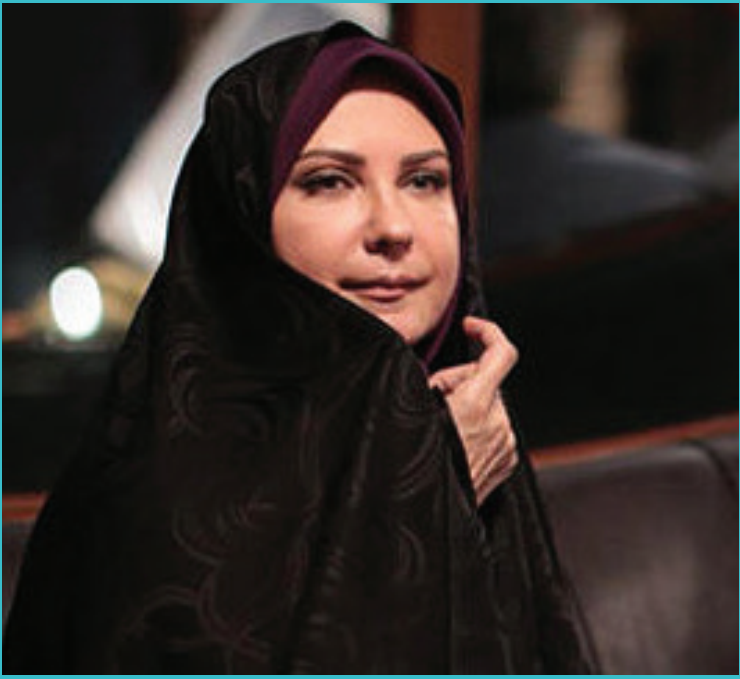
در گفت‌وگو با «صبا» مطرح شد