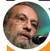
بازگشت مسعود فراستی به قاب تلویزیون

صبا: با پایان مجموعه تلویزیونی «وفا»، سریال «عمارت فرنگی» از ساخته‌های محمدرضا ورزی روی آنتن شبکه افق می‌رود. این سریال در ۱۵ قسمت و با تهیه‌کنندگی علی لدنی ساخته شده و بازیگرانی همچون سعید نیک‌پور، احمد نجفی، محمد مطیع، محمد ابراهیمی، سپیده گلچین، حسین نور علی، چنگیز وثوقی، خسرو فرخزادی، فریده دربان، مسعود عجمی، صنم نکوآقبال، میرطاهر مظلومی و آتابک نادری در آن به ایفای نقش پرداخته‌اند. خط اصلی داستان سریال «عمارت فرنگی»، اتفاقات دوران سلطنت رضاشاه است که مابین سال‌های ۱۲۹۶ تا ۱۳۲۰ می‌گذرد. داستان سریال با امضای قرارداد ۱۹۱۹ شروع می‌شود یعنی از جایی که وثوق الدوله آن را به سرانجام می‌رساند، اما ای‌تاله سیدحسن مدرس به شدت با آن مخالفت می‌کند و این مخالفت سبب به وجود آمدن موجی از اعتراضات می‌شود؛ اعتراضاتی که وثوق الدوله را وادار به لغو قرارداد می‌کند... مجموعه «عمارت فرنگی» هر شب به‌جز جمعه‌ها ساعت ۲۳:۳۰ از شبکه افق پخش می‌شود و تکرار آن هم ساعت‌های ۹:۳۰ و ۱۵:۳۰ روز بعد روی آنتن می‌رود.