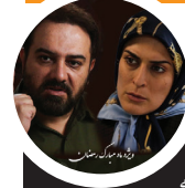
«بچه مهندس» به نگارش فاز سوم رسید