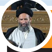
«عمارت فرنگی» جایگزین «وفا» در شبکه افق می‌شود

صبا: با پایان مجموعه تلویزیونی «وفا»، سریال «عمارت فرنگی» از ساخته‌های محمدرضا ورزی روی آنتن شبکه افق می‌رود. این سریال در ۱۵ قسمت و با تهیه‌کنندگی علی لدنی ساخته شده و بازیگرانی همچون سعید نیک‌پور، احمد نجفی، محمد مطیع، محمد ابراهیمی، سپیده گلچین، حسین نور علی، چنگیز وثوقی، خسرو فرخزادی، فریده دربان، مسعود عجمی، صنم نکوآقبال، میرطاهر مظلومی و آتابک نادری در آن به ایفای نقش پرداخته‌اند. خط اصلی داستان سریال «عمارت فرنگی»، اتفاقات دوران سلطنت رضاشاه است که مابین سال‌های ۱۲۹۶ تا ۱۳۲۰ می‌گذرد. داستان سریال با امضای قرارداد ۱۹۱۹ شروع می‌شود یعنی از جایی که وثوق الدوله آن را به سرانجام می‌رساند، اما ای‌تاله سیدحسن مدرس به شدت با آن مخالفت می‌کند و این مخالفت سبب به وجود آمدن موجی از اعتراضات می‌شود؛ اعتراضاتی که وثوق الدوله را وادار به لغو قرارداد می‌کند... مجموعه «عمارت فرنگی» هر شب به‌جز جمعه‌ها ساعت ۲۳:۳۰ از شبکه افق پخش می‌شود و تکرار آن هم ساعت‌های ۹:۳۰ و ۱۵:۳۰ روز بعد روی آنتن می‌رود.