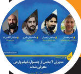
ستار ۱ هشتر جشنواره فیلم وارث معرفی شدند

مدیران ۴ بخش از جشنواره فیلم وارث معرفی شدند