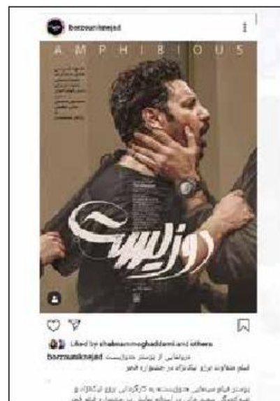
برزو نیک نژاد، پوستر فیلمش را در اینستاگرام منتشر کرد و آن را «متفاوت» خواند.