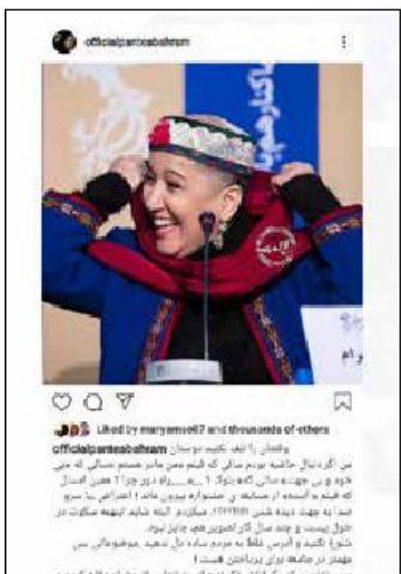
پانته آ بهرام با انتشار تصویری خندان و یک پیام اینستاگرامی جواب منتقدانش را داد.