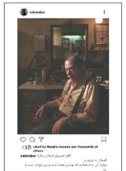
صابر ابر با انتشار عکسی از علی نصیریان در «خورشید» زادروز او را تبریک گفت.