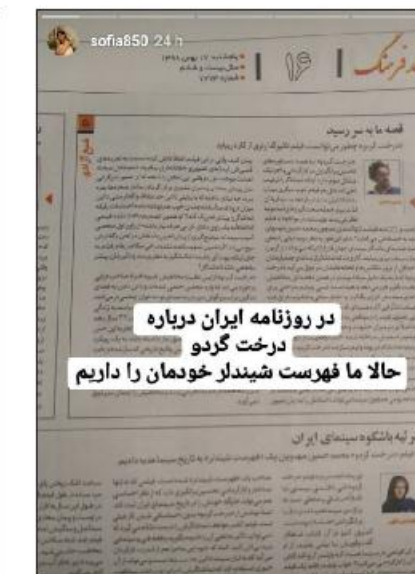
تعبیر جالب یک منتقد از «درخت گردو»: شیندرلیست ایرانی!