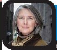
صدرنشین رمان جدید لوئیس پنی

استنا: رمان جدید لوئیس پنی با عنوان «یک مرد بهتر» توانست در اولین هفته حضور خود در فهرست پر فروش‌های داستانی (hard cover)، جایگاه اول را از آن خود کند و به سلطه چندین هفته‌ای «جایی که خرچنگ‌ها آواز می‌خوانند» پایان دهد. رمان «یک مرد بهتر» که یازدهمین کتاب از سری داستان‌های پلیسی «سر بارز گلماج» محسوب می‌شود، داستان سختی‌های جست‌وجوی یک دختر گمشده در شرایط سخت سیلان‌های شدید منطقه را روایت می‌کند. رمان «جایی که خرچنگ‌ها آواز می‌خوانند» نوشته دلایونز که با قدرت برای پنجاه و یکمین هفته متوالی در فهرست پنج کتاب پر فروش داستانی نیویورک تایمز حضور دارد، این بار در جایگاه دوم لیست به چشم می‌خورد. رمان «دختری که دوبار زندگی کرد» نوشته دیوید لاکر کرانتس نویسنده سوئدی کتاب زندگی‌نامه «رالاتان ابراهیم‌مویچ» نیز از دیگر آثار جدید این فهرست است. از این کتاب می‌توان به عنوان ششمین جلد از سری داستان‌های شخصیت «لیست سالاندر» یاد کرد. «دختری که دوبار زندگی کرد» در اولین هفته حضور خود در فهرست پر فروش‌ها در جایگاه سوم قرار دارد. دانیل لیتل نویسنده پر فروش و بر کار آمریکایی نیز با رمان جدید خود با عنوان «بهد تاریخ» برای پنجمین بار در سال جاری به جمع پر فروش‌ها بازگشته است. «لنتیل» در این رمان داستان زنی به نام «ژوئی مورگان» را روایت می‌کند که خاطرات تاج کودکی اش پس از تولد در زندگی به او هجوم می‌آورند.