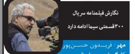
نگارش فیلمنامه سریال