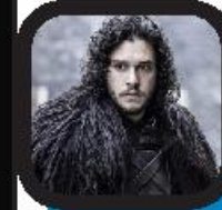
خبرهایی تازه درباره ادامه سریال «بازی تاج و تخت»