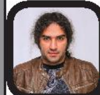
رضا یزدانی برای «ترور خاموش» خواند