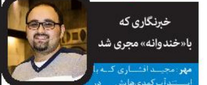
خبرنگاری که با «خندوانه» مجری شد