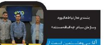
یست در حال باطال بود و سازمان سیار چه استفاده مستند

ا برن: هفاد ویکمیرن دوره پخش هنرهای خلاق جایزه امی Creative Arts Emmy Awards شنبه و یکشنبه (۲۳ و ۲۴ شهریور) در سالن ماکروسافت شهر لس‌آنجلس آمریکا برگزار شد. این پخش از جایزه امی که به شناخت و تقدیر از عوامل پشت‌صحنه فیلم‌ها و سریال‌های تلویزیونی، مانند طراحان صحنه، طراح لباس، آهنگسازان، دستیار فیلمبردار، صدابردار و صداسازی، جادوهای ویژه و مانند آن‌ها تعاق می‌گردد زودتر از جایزه امی (۲۲ سپتامبر) اول مهر (۲۸) برندگان خود را شناخت. رامین جوادی آهنگساز آلمانی ایرانی تبار سریال «تاج و تخت» نیز توانست جایزه بهترین موسیقی را در این دوره از جوایز امی کسب کند. او که از اوایل قرن بیستم کار آهنگسازی را آغاز کرد، پیش از این نیز برنده جایزه گرمی برای آهنگسازی فیلم «مرد آهنین» شده بود و آهنگسازی سریال‌های مختلفی از جمله «فرار از زندان» بر عهده داشته است. جایزه امی یا به‌طور خلاصه امی Emmy Award جایزه‌ای است که بهترین آثار تلویزیونی ساخته‌شده در سال گذشته را می‌شناسد. این جایزه در چندین مراسم مختلف و عموماً پیرزرق و برق در لس‌آنجلس برگزار می‌شود که هر کدام بخش‌های مختلفی از صنعت سریال‌سازی را در خود جا داده‌اند. دو مراسم مهمی که بیشترین بیننده را به خود جلب می‌کنند جوایز امی آثار دربیخته و جوایز امی آثاری است که در ساعات روز پخش می‌شوند.