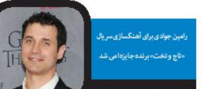
رامین جوادی برای آنتگاسازی سریال «تاج و تخت» برنده جایزه‌ای شد

مهر: مجید افشاری که با استناد کم‌دی‌هایش در «خندوانه» شناخته شد، درباره حضور خود به‌عنوان مجری در تلویزیون گفت: من سال‌ها خبرنگار بودم اما شرکت در «خندوانه» و اجرای استندآپ کم‌دی در این برنامه باعث شد که بیشتر روی کار اجرا تمرکز کنم و بعد هم به حوزه بازیگری وارد شدم. بعد از آن تهیه‌کننده «شما و آی‌فیلم» برای یک ویژه‌برنامه نوروزی با من تماس گرفت که استقبال مخاطبان از آن برنامه نوروزی موجب شد که این همکاری ادامه پیدا کند. او درباره جنس حضورش در برنامه‌ای که اکنون اجرای آن را بر عهده دارد، گفت: «شما و آی‌فیلم» در فصل‌های قبل چندان طنز نبود اما در فصل‌های اخیر و حالا و شاید به علت حضور مجری سری‌کابل و من، رویه دیگری را در پیش گرفته است البته من به آن معنا استندآپ اجرا نمی‌کنم، بلکه درباره مسائل مختلف روز جامعه با لحن طنز و شوخی صحبت می‌کنم. اصولاً سعی داریم در این برنامه خیلی درباره موضوعات صحبت نکنیم. موضوعات مطرح در برنامه را هم یک اتاق فکر انتخاب می‌کنند و روی آن مانور می‌دهند. در فصل جدید «شما و آی‌فیلم» بیشتر روی دغدغه‌های جامعه و مردم کار می‌کنیم و مسائلی که خودمان هم به‌نوعی با آن‌ها درگیر هستیم؛ مثل محیط زیست، ترافیک، معضلات آموزشی و... شاید هم استقبال مخاطبان از سری‌های جدید «شما و آی‌فیلم» به همین دلیل باشد.