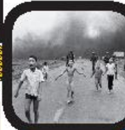
عکس های نکل دهنده از زخم های جنگ ویتنام