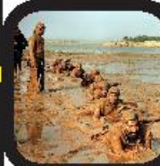
مروری بر هشت سال دفاع مقدس در شبکه پرس تی وی