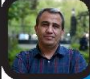
«پيله آهنی» به پايان راه رسيد