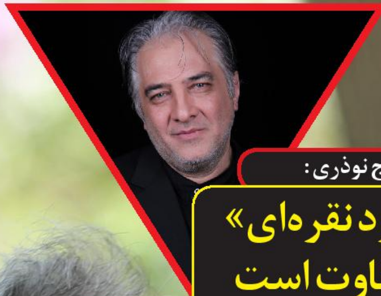
ابرج نوذری : «مرد تفرهای» متفاوت است