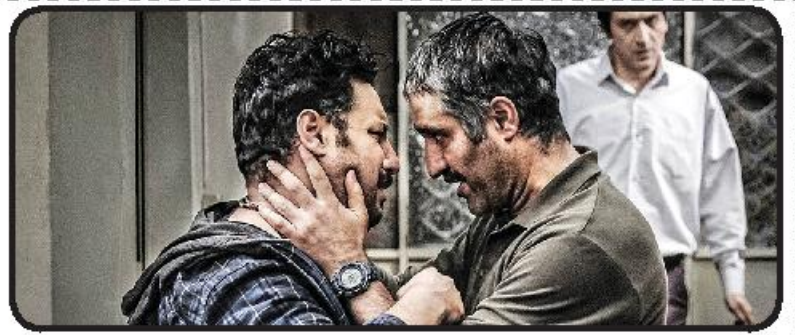
گولاگ «دو زیست» در تاجیکستان