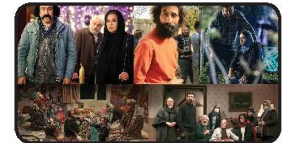
۵ فیلم جدید به سینماهای آید

مستند «کامیون آبی» و انیمیشن «گذشته» از تولیدات مرکز گسترش به‌جشنواره فیلم کرالا راه یافتند. «کامیون آبی» به کارگردانی هادی آفریده و انیمیشن کوتاه «گذشته» به کارگردانی حمید محمدی، از تولیدات مرکز گسترش به بخش بین‌الملل چهاردهمین جشنواره فیلم‌های مستند و کوتاه کرالا در کشور هندوستان راه یافتند. «کامیون آبی» در چهاردهمین جشنواره «سینما حقیقت» نمایش داده شد. ضمن اینکه انیمیشن «گذشته» در جشنواره‌های فیلم فجر، بوئلمایی تهران و... نمایش داشته و تندیس نقره بهترین دستاورد فنی و هنری جشنواره بوئلمایی را هم به دست آورده است. این جشنواره که توسط آکادمی فیلم ایالت کرالا راه‌رسله در تریولدروم (مرکز ایالت کرالا) برگزار می‌شود، یکی از چهار جشنواره مستند مورد تأیید آکادمی علوم و هنرهای سینمایی اسکار در آسیاست و بهترین مستند کوتاه و بهترین مستند بلند آن به اسکار معرفی خواهد شد. جشنواره کرالا از ۴ تا ۹ شهریور ماه ۱۴۰۱ برگزار می‌شود. اخیرگزاری اپنا