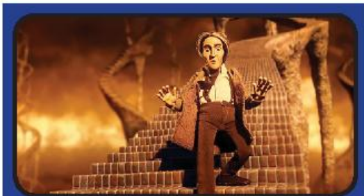
کامیون آبی بدون توقف تا هندوستان