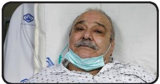
کاسبی در آی. سی. یو بستری شد

محمد کاسبی، بازیگر پیشکسوت سینما و تلویزیون به دنبال نارسایی قلبی در بخش بست آی سی یو بیمارستان بستری شد. یلدا کاسبی، دختر این هنرمند اظهار کرد: پدرم چهارشنبه هفته گذشته، ۱۹ مرداد ماه به دنبال مشکلات نارسایی قلبی به بیمارستان و بخش آی سی یو منتقل شد و یکشنبه ۲۳ مرداد به بخش بست آی سی یو منتقل شده است. او از مردم خواست برای پدرش دعا کنند. یلدا کاسبی گفت: اوضاع قلب پدر خوب نیست و شرایط عمومی ایشان هم چندان مطلوب نیست. پزشکان برای درمان مناسب تمام تلاششان را به کار بسته‌اند. در حال حاضر پدرم تحت نظر دکتر معالجش بلیک شریف کشلی، فوق تخصص نارسایی‌های قلبی است. از مردم می‌خواهم باز هم برای پدرم دعا کنند تا ببینیم خدا چه می‌خواهد. محمد کاسبی هنرمند باسابقه عرصه سینما و تلویزیون و اواخر سال ۱۴۰۰ از ناحیه درجه قلب تحت عمل جراحی قرار گرفت و طی این مدت چندین بار به علت نارسایی قلبی در بیمارستان بستری شد. اخیرگزاری اپنا