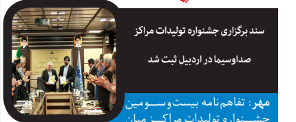
سند برگزاری جشنواره تولیدات مراکز

سریال لر نیستند ولی در کنار ما اقوام لری قرار دارند که می‌توانند و لازم است به ما کمک کنند که با گویش لری به درستی حرف بزنیم. گودرزی با بیان این که «ایل دا» از نیمه مردادماه جلوی دوربین می‌رود، مطرح کرد: من یکی از نقش‌های اصلی این سریال را ایفا می‌کنم و معتقدم از آن جایی که این سریال قصه متفاوتی دارد می‌تواند مخاطب را پای تلویزیون نگه دارد. او در ادامه با اشاره به این که به‌تازگی دو تله‌فیلم با موضوعات اجتماعی کار کرده است، تصریح کرد: «نبض نگاه» به کارگردانی سیدمجتبی اسدی پور را کار کردم که احتمالاً در جشنواره فیلم کودکان و نوجوانان اصفهان شرکت می‌کند. «مامان مهشید» به کارگردانی نوید اسماعیلی نام دومین فیلمی است که من در آن همان نقش نام فیلم یعنی مامان مهشید را ایفا کرده‌ام. بازیگر سریال «لحظه گرگ و میش» در پاسخ به این پرسش که چرا ساخت تله‌فیلم در تلویزیون کم شده است، اظهار کرد: کمبود بودجه در تلویزیون علت اصلی کم شدن ساخت تله‌فیلم در این رسانه است و برای حل این مشکل کافی است بودجه آن تامین شود. «ایل دا» به کارگردانی راما قویدل، نویسندگی نوشین پیرحیاتی و تهیه‌کنندگی سیدعلیرضا سبط‌احمدی در ۲۶ قسمت و هشتاد لوکیشن مختلف در مناطق بکر و منحصر‌به‌فرد لرستان و در فضایی کاملاً روستایی و بومی تولید خواهد شد. موضوع این سریال اتحاد، همبستگی و ایستادگی مردان و زنان عشایر و روستایی مناطق مرزنشین و غرب کشور در برابر متجاوزان خارجی، خائنان داخلی و وطن‌فروشان به خاک این مرز و بوم است و قصه ایثار و فداکاری مردم غرب کشور در سال‌های ۱۳۵۸ و ۱۳۵۹ را روایت می‌کند.