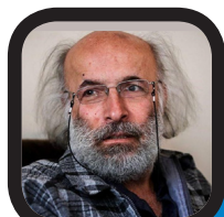
نامزدهای دومین دوره جایزه آکادمی

هالیوود، روز جمعه دوم اگوست با حضور در موزه‌های در رم و قرائت شعری از گابریل تینتی شاعر ایتالیایی، بازدیدکنندگان را شوکه کرد. هنوز معلوم نیست هدف اسپسی از این نمایش چه بوده است. دنیای کوین اسپسی از سال ۲۰۱۷ و متهم شدن به آزار جنسی چندین نفر در سال‌های مختلف، متلاطم و به هم ریخته است. دادگاه رسیدگی به این اتهامات از مدت‌ها قبل ادامه دارد، اگر چه به‌تازگی او از یکی از اتهامات اصلی خود که مربوط به آزار مردی ۱۸ ساله در تانناکت در ایالت ماساچوست بود، تبرئه شده است. شعری که اسپسی در موزه قرائت کرد «بوکسور» نام داشت و او آن را در کنار مجسمه برنزی «بوکسور در آرامش» قرائت کرد؛ قطعه شعری که مضمون آن درباره بوکسوری است که خسته و در هم شکسته، مضروب و خونین در گوشه رینگ رها شده است. کوین اسپسی پیش از این و در تعطیلات سال نو میلادی نیز ویدئویی عجیب از خود منتشر کرد و با اجرایی در قالب شخصیت فرانک اندروود در سریال «خانه پوشالی»، از مخاطبان خواست برای قضاوت عجله نکنند.