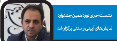
نشست خبری نوزدهمین جشنواره

بلیت‌فروشی کنسرت «صنم ناهنجار» علی قمصری در فرهنگسرای ارسباران تهران انجام می‌گیرد و علاقه‌مندان به حضور در این اجرا می‌توانند برای تهیه بلیت به سامانه فروش بلیت ایران کنسرت مراجعه کنند.