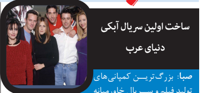
ساخت اولین سریال آبکی