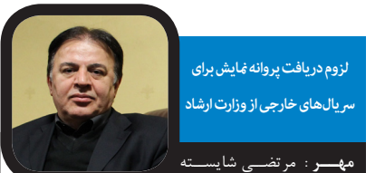
لزوم دریافت پروانه نمایش برای سریال‌های خارجی از وزارت ارشاد