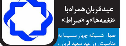
عید قربان همراه با «نغمه‌ها» و «صراط»