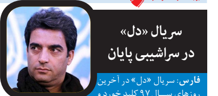
سریال «دل» در سرایشی پایان

دارند، همچنین سریال «نفس» که در سه فصل برای شبکه سه سیما تولید شده است و اولین فصل آن در ماه رمضان سال ۹۶ روی آنتن رفت همچون دو اثر گذشته «ارمغان تاریکی» و «پروانه» به داستانی پر حادثه در بستر رویدادهای انقلاب می‌پردازد. از جمله فعالیت‌های رضا نصیری‌نیا در تلویزیون می‌توان به سریال «آچمز» به کارگردانی مهرداد خوشبخت اشاره کرد که مدیر تولید این سریال است.