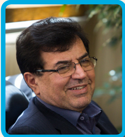
واکنش وزیر فرهنگ و ارشاد اسلامی به حیوان‌آزایی