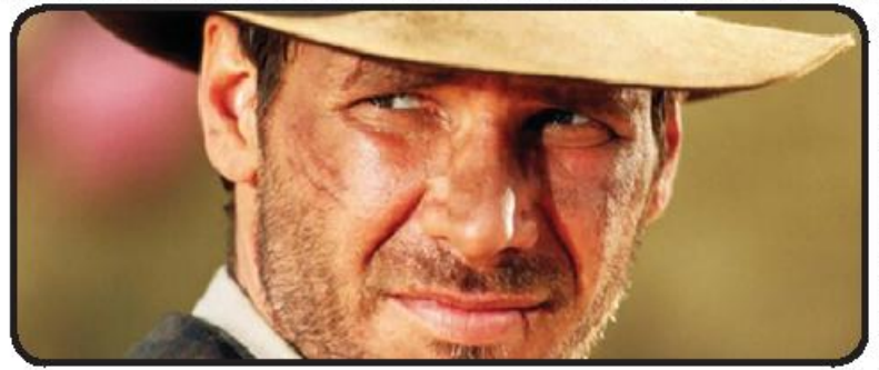
هریسون فور، جوان شد

هریسون فور، در اولین تصاویری که از «ایندیانا جونز ۵» منتشر شده، دوباره در همان اندازه‌های ماجراجویی فیلم‌های قبلی دیده شد. این عکس‌ها تایید می‌کنند که فور با استفاده از جلوه‌های بصری جوان شده تا سن او با سه‌گانه اصلی متناسب شود. از فن‌آوری پیری‌زدایی تنها در صحنه آغازین فیلم استفاده شده که در قلعه‌ای در سال ۱۹۴۴ ایندیانا را در مقابل گروهی از نازی‌ها تصویر می‌کند. جیمز منگولد، که وظیفه ساخت فیلم را از لستون اسپیلبرگ گرفته است، گفت: پس از سکانس آغازین، شما خود را در سال ۱۹۶۹ می‌یابید. مخاطب به معنای واقعی کلمه روحیه هولناک آن روزهای اولیه در دهه ۱۹۴۰ را تجربه می‌کند و بعد وارد امر و ز فیلم می‌شویم. مهر