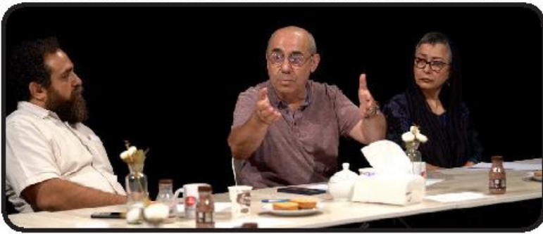
«طناز» به فاز اول خود پایان داد

هریسون فور، در اولین تصاویری که از «ایندیانا جونز ۵» منتشر شده، دوباره در همان اندازه‌های ماجراجویی فیلم‌های قبلی دیده شد. این عکس‌ها تایید می‌کنند که فور با استفاده از جلوه‌های بصری جوان شده تا سن او با سه‌گانه اصلی متناسب شود. از فن‌آوری پیری‌زدایی تنها در صحنه آغازین فیلم استفاده شده که در قلعه‌ای در سال ۱۹۴۴ ایندیانا را در مقابل گروهی از نازی‌ها تصویر می‌کند. جیمز منگولد، که وظیفه ساخت فیلم را از لستون اسپیلبرگ گرفته است، گفت: پس از سکانس آغازین، شما خود را در سال ۱۹۶۹ می‌یابید. مخاطب به معنای واقعی کلمه روحیه هولناک آن روزهای اولیه در دهه ۱۹۴۰ را تجربه می‌کند و بعد وارد امر و ز فیلم می‌شویم. مهر