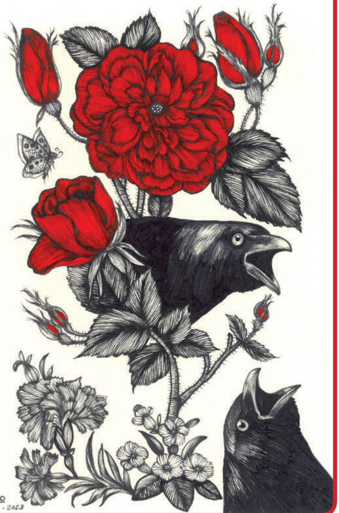
اصباخبر ۸ - ۲۰۲۳

محسن احمدوند درباره طنزی که در اکثر آثارش پیدا است می‌گوید: طنزی که وجود دارد یا طنز تلخ است یا بابت این است که فضا و روحیه کار تغییر کند. چون هنر