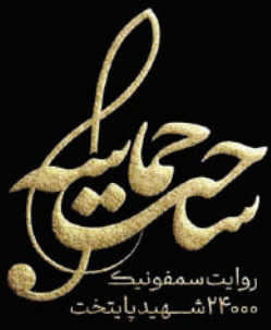
روایت سمفونیک ۲۴۰۰۰ شهید پایتخت

علیرضا پلیسچی خواننده موسیقی پاپ در حالی تازه‌ترین کنسرت خود را در مرکز همایش‌های برج میلاد تهران پیش روی مخاطبان قرار داد، که رضارویگری بازیگر پیشکسوت کشورمان مهمان ویژه این اجرا بود. اجراهای زمستانی پلیسچی برای سومین بار تمدید شد و این خواننده قرار است هشتم بهمن سال جاری نیز در سالن اسپیناس تهران به صحنه برود. «زندگی جونم»، «تو فکر می‌کنی کی ای»، «نفس کی بودی تو»، «ای داد بر من»، «دیوونه دوست داشتنی»، «لیلا»، «یه دریا نریم»، «دل به دل»، «قاف» و «سختگیر»، «به تو چه» و... قطعاتی بودند که به اجرا درآمدند. پلیسچی همانند اجراهای پیشین خود قطعه پرمطرب «پا قدم» را با همراهی ارکستر زهی، دوبار به اجرا درآورد. امهر