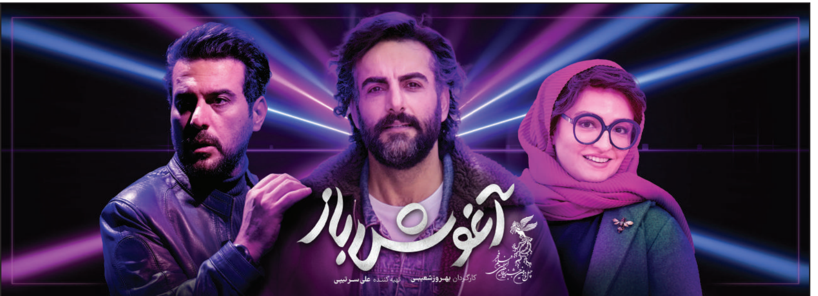
کارگردان: بهروز شعیبی | تهیه‌کننده: علی سرتیسی