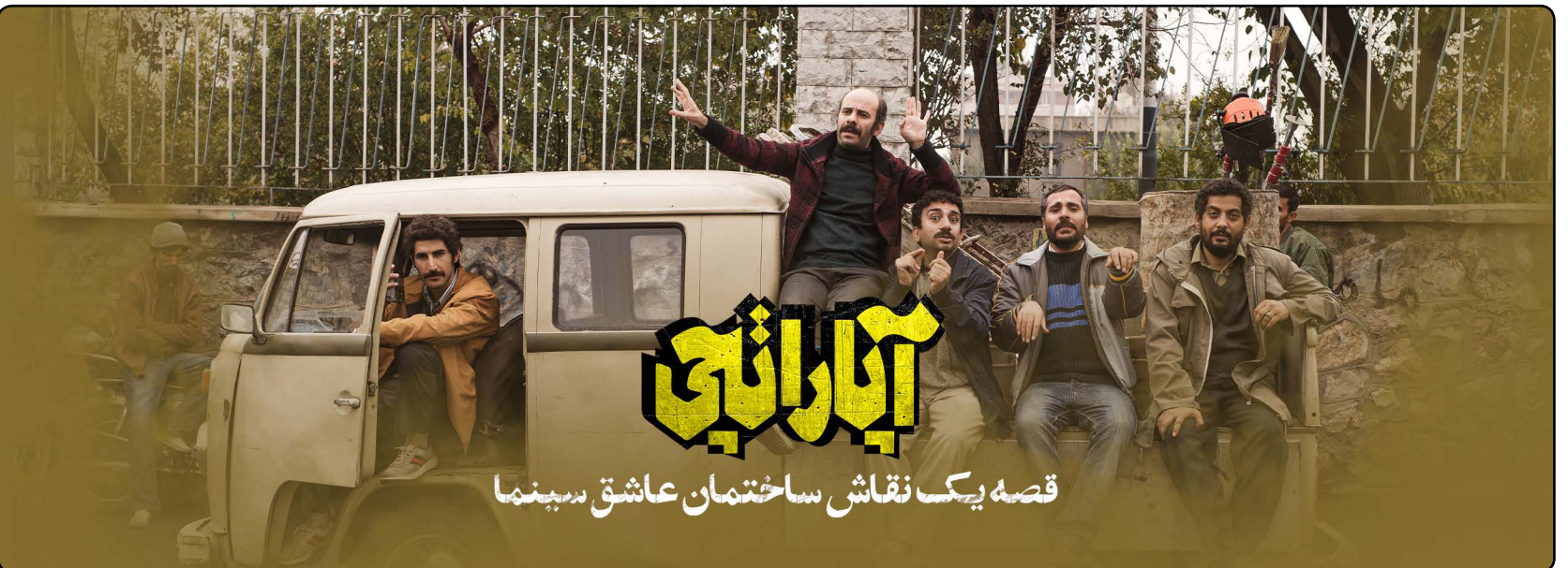
قصه یک نقاش ساختمان عاشق بسینما