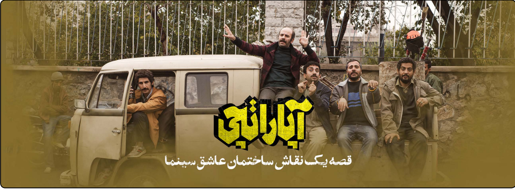
قصه یک نقاش ساختمان عاشق بسینما