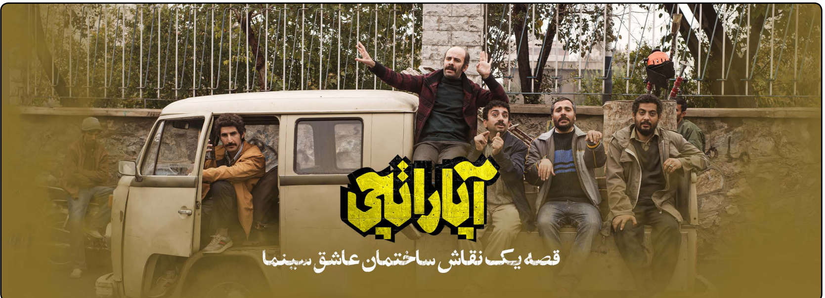
قصه یک نقاش ساختمان عاشق بسینما