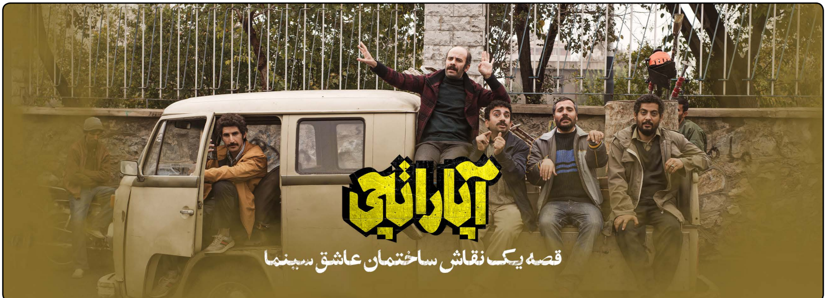
قصه یک نقاش ساختمان عاشق اسپینما

تهیه‌کننده «فسیل» درباره برخی نگاه‌های به‌شدت منفی و تند که به تولید و اکران فیلم‌های کمدی این روزهای سینما می‌شود، بیان کرد: من نمی‌دانم علت این نظرات و نقدها چیست، ولی معتقد هستم که یک فیلم باید برای مردم ساخته شود و مخاطب فیلم‌هایی که من نیز ساختم و در آینده نیز مقابل دوربین می‌برم، مردم عام هستند همانطور که مردم نیز این فیلم‌ها را دوست داشتند و از آن‌ها استقبال کردند. بنابراین من فکر می‌کنم اگر کسی به «فسیل» برچسب مبتذل را بچسباند، به هفت میلیون نیم مخاطبی که این اثر داشته توهین کرده است، چرا که این فیلم از سوی مخاطب دیده شده است... البته باید این را هم در نظر بگیریم که در سینمای کمدی هم فیلم خوب و فیلم بد وجود دارد و برای تمامی آثار کمدی نیز اتفاقات خوبی رقم نمی‌خورد. پس زمانی یک فیلم کمدی دیده می‌شود که مردم آن را دوست داشته باشند و فیلم خوبی هم ساخته شده باشد.