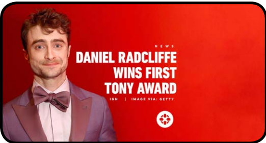
DANIEL RADCLIFFE WINS FIRST TONY AWARD