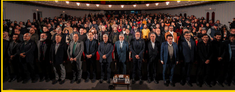
آیین اختتامیه هجدهمین جشنواره بین‌المللی فیلم مستند ایران، «سینما حقیقت» شب گذشته ۲۵ آذر ماه با حضور سیدعباس صالحی وزیر فرهنگ، راند فریدزاده رییس سازمان سینمایی، محمد حمیدی مقدم دبیر جشنواره و جمعی از فیلمسازان و داوران در تالار وحدت برگزار شد.

شهرستان‌ها هستند و این نشانگر این است که از جای جای ایران هنرمندان برای مستندسازی اهتمام می‌ورزند. سینمای مستند ایران پیش از آنچه که هست ظرفیت دارد و بر عهده ما است که این ظرفیت را شناخته و به آن بها دهیم. این سینما با انباشت ظرفیت‌ها و استفاده از مضمون‌های بکر و تکنیک‌های تازه مخاطب را به سینمای مستند متصل کرد. هدف دیگر ما بازارهای بین‌المللی و حضور مستندهای ایرانی در عرصه بین‌المللی است زیرا این سینما حرف‌های بسیاری برای منطقه و جهان دارد.