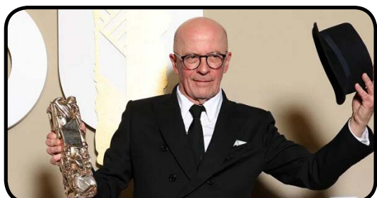
«امیلیا پرز» بهترین فیلم اسکار فرانسه شد

چهل و پنجمین دوره جوایز تمسک طلایی برای معرفی بدترین‌های سال هالیوود، بر گزیدگان خود را شناخت و فیلم «مگالوپولیس» پروژه ۱۲۰ میلیون دلاری فرانسیس فورد کاپولا، تمسک طلایی بدترین کارگردانی و بازیگر مکمل مرد (جان ویت) را دریافت کرد. فرانسیس فورد کاپولا، کارگردان افسانه‌ای سینما، با انتشار پستی در اینستاگرام از دریافت چندین نامزدی تمسک طلایی (رازبری) برای فیلم علمی تخیلی اش «مگالوپولیس» «باز خوشحالی کرد». او این نامزدی‌ها را نشانه شجاعت خود در خلاف جهت جریان اصلی سینما دانست و از همکاری‌اش برای ساخت این اثر هنری تقدیر کرد. کاپولا نوشت که جایزه تمسک طلایی برای او یک افتخار ویژه است، چرا که تعداد کمی جسارت مقابله با جریان غالب فیلمسازی معاصر را دارند! فیلم سینمایی «مگالوپولیس»، هنگام اکران خود با نقدهای بسیار منفی مواجه شد و تنها ۱۴ میلیون دلار از ۱۲۰ میلیون دلار هزینه تولیدش را در گیشه به دست آورد. ایسنا