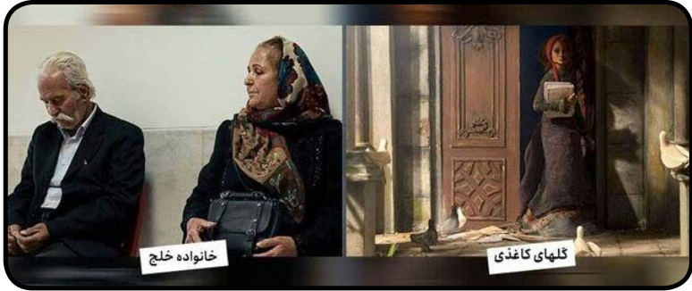
«گل‌های کاغذی» و «خانواده خلیج» به از میر می‌روند