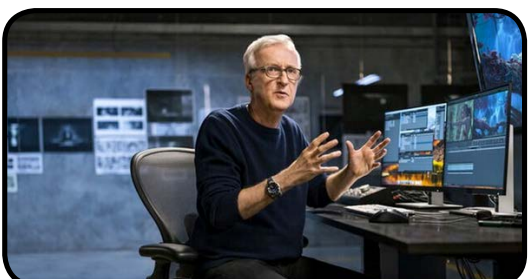
فرار کارگردان «تایتانیک» از آمریکا

جیمز کامرون، کارگردان «تایتانیک» و مجموعه فیلم‌های «آواتار»، با بیان این که آمریکا تحت رهبری دونالد ترامپ از همه چیزهای ارزشمندی که داشته منحرف شده است گفت، شهروندی نیوزلند را انتخاب کرده و این کشور را به زادگاهش کانادا هم ترجیح می‌دهد. کامرون دور دوم ریاست جمهوری ترامپ را «وحشتناک» و «ترسناک» توصیف کرد و افزود که این دوره انحرافی از همه ارزش‌های شایسته است و اگر آمریکا به اصول و ارزش‌های خود پایبند نباشد، دیگر نماد یا نماینده چیزی نخواهد بود. این کارگردان پرآوازه، وضعیت ارزش‌های تاریخی آمریکا با ترامپ را به یک ایده بوچ و توخالی تشبیه کرد و تأکید کرد که آن‌ها به سرعت در حال تضعیف این اصول و ارزش‌ها هستند تا از این طریق به منافع شخصی خود برسند. این کارگردان یک مزرعه بزرگ لبنیات در منطقه‌ای در نیوزیلند دارد و فیلم‌های «آواتار» را در استودیو وست دیجیتال واقع در ولینگتون، سومین شهر بزرگ نیوزیلند، ساخته است. افارس